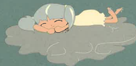
Illustration und Gestaltung:

Museum Lüneburg Deutsches Salzmuseum Ostpreußisches Landesmuseum Kloster Lüne